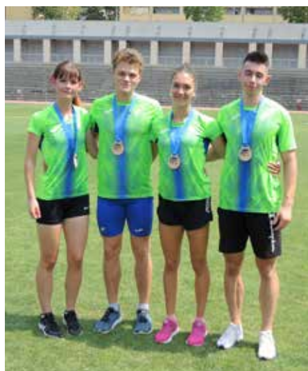
Zmagovita mlajša članska mešana štafeta Slovenije na igrah Alpe Adria