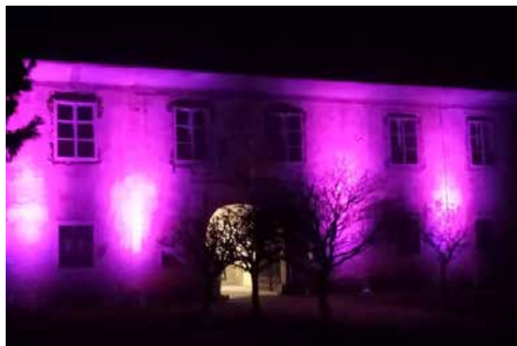
Prav tako je v znak podpore ob mednarodnem dnevu invalidov Občina Beltinci osvetlila grajsko poslopje v vijolično barvo.