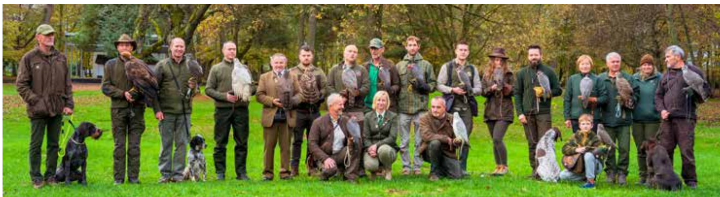
Skupna fotografija udeležencev lova

Javni zavod za turizem, kulturo in šport Beltinci, Sokolarsko društvo Pomurja in Slovenska zveza za sokolarstvo in zaščito ptic ujed so v soboto, 5. novembra 2022, ob 9.30 na dvorišču beltinskega gradu organizirali že XIV. odprtje lova s sokoli v Pomurju.