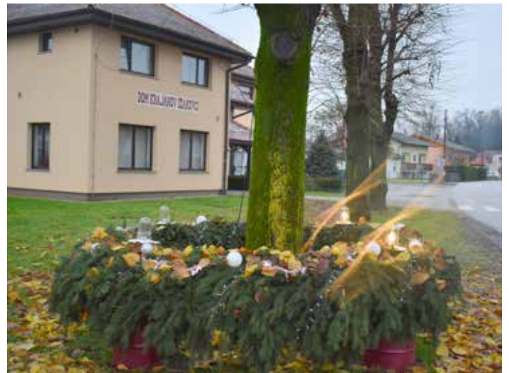
Adventni venček v KS Ižakovci