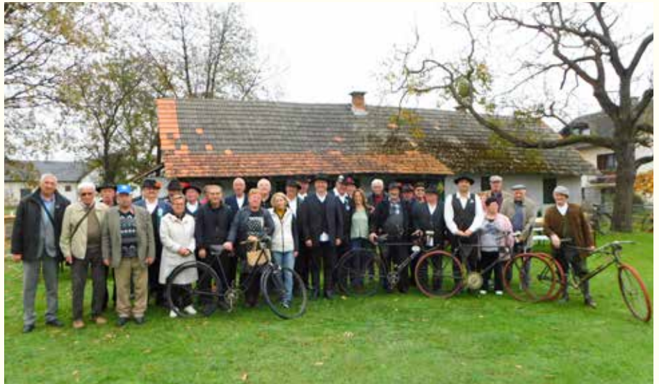
Člani društva starodobnikov – ljubiteljev starih koles Dimek Beltinci - so s panoramsko vožnjo zaključili letošnjo bogato kolesarsko sezono