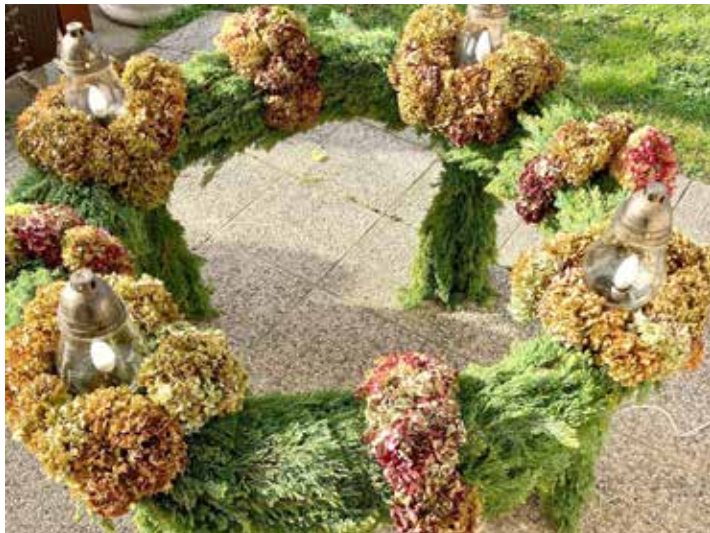
Adventni venček pri kapeli Melinci, oblikovali člani KUD Melinci