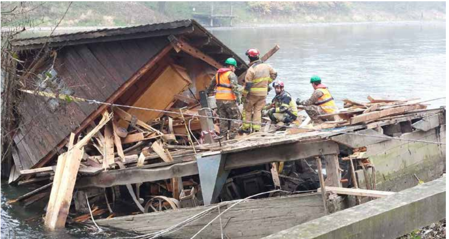
Odstranjevanje ostankov potopljenega mlina

Občina Beltinci in Javni zavod za turizem, kulturo in šport Beltinci