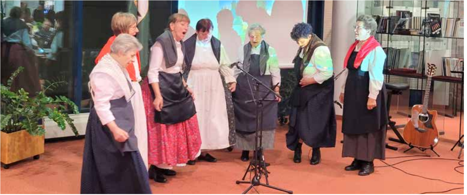
Nastop ljudskih pevk "Jesensko listje" iz Dokležovja na slovesnosti ob Jeričevih dnevih v Murski Soboti