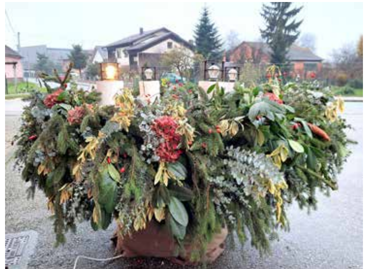
Adventni venček KS Gančani