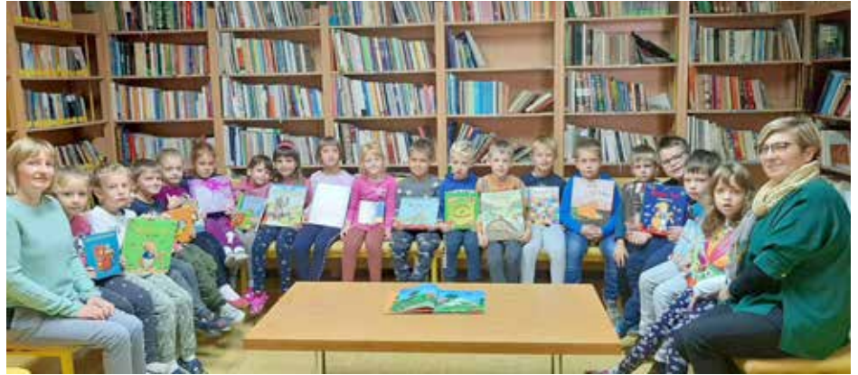
1. c Prvič skupaj v šolski knjižnici

d) Čas pred jesenskimi počitnicami smo izkoristili, da smo učence 7., 8. in 9. razreda spodbujali k branju, spregovorili o knjigah, o pomenu branja, o tem, kako je čas za branje potrebno načrtovati. Učenci so opisovali svoj prosti čas. Dobro je, da vanj vključimo tudi branje. Učenci so si izposodili knjigo domačega branja. Obljubili so, da bodo ob večerih našli čas tudi za branje.