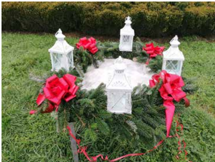
Adventni venček v KS Lipa