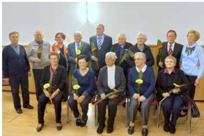
Jubilanti 80 let, avtor Kuzma Jože

1. oktober je mednarodni dan starejših, ki smo ga v DU Beltinci namenili našim jubilentom, 80, 90, 100 in 106 - letnikom, kakor tudi zlatim in diamantno poročenim parom.