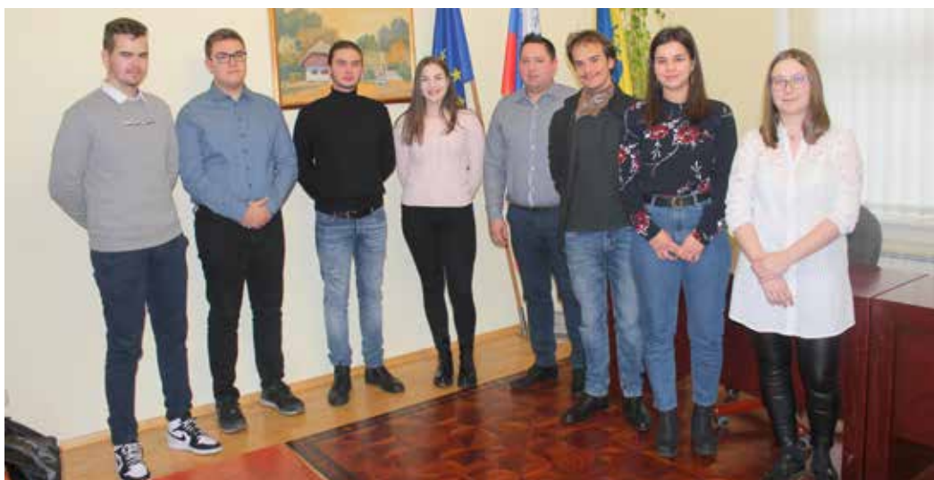
Letošnji štipendisti in štipendistke Občine Beltinci.