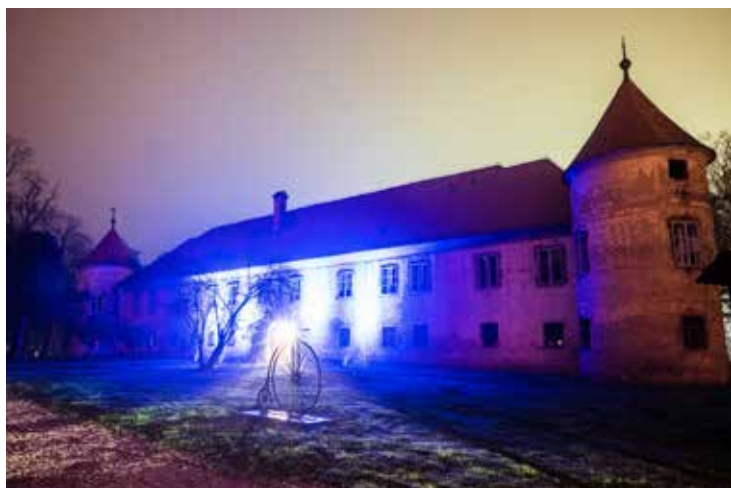
V znak podpore bolnikov z diabetesom je Občina Beltinci osvetlila grajsko poslopje v modro barvo.